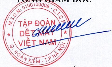
Cao Hữu Hiếu